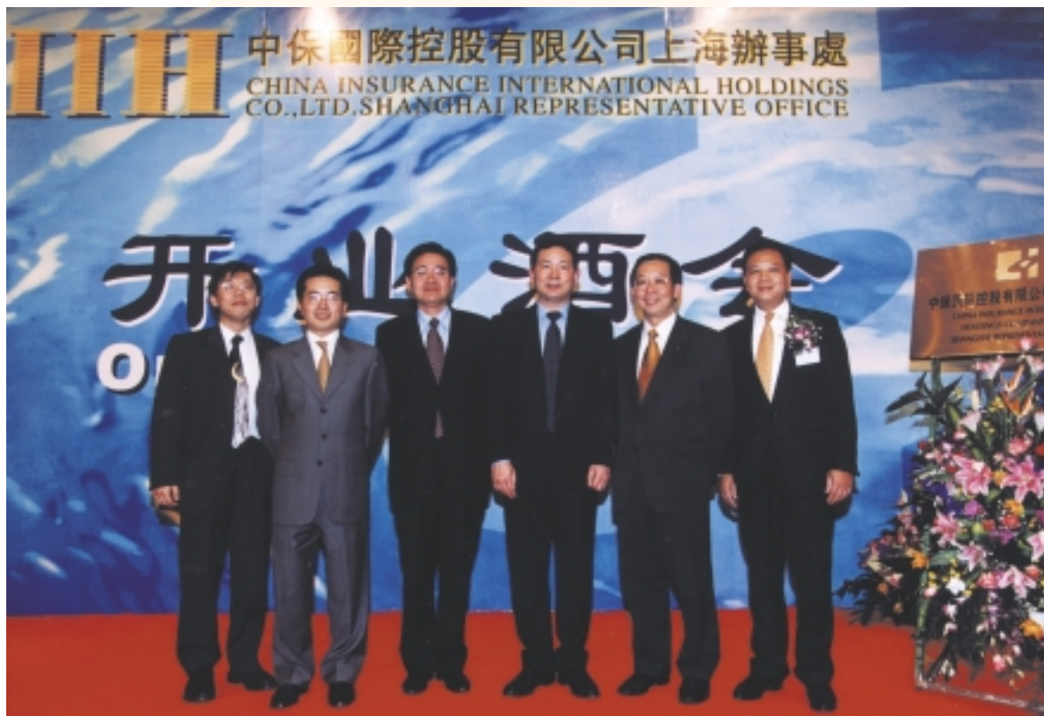
中保國際上海辦事處二零零一年二月二十八日開業酒會